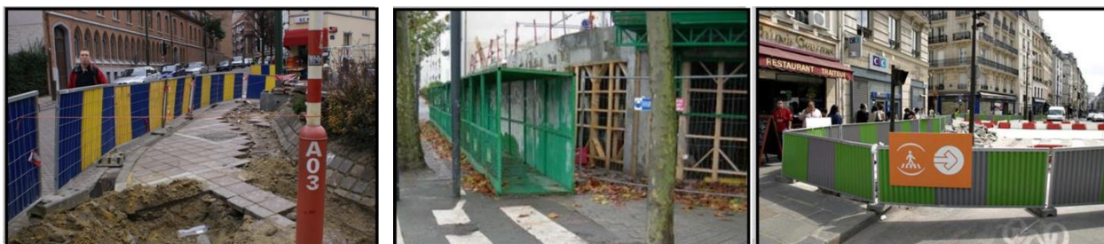
Protections et signalisation