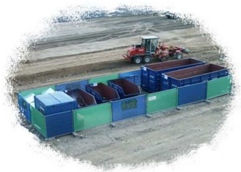
Aire de stockage des déchets

Les aires de stockage des bennes seront aménagées sur une chape ou tout autre procédé assurant une étanchéité vis-à-vis du sol naturel et des réseaux d'eaux pluviales, avec rigoles en pourtour et rejet dans un bac de décantation de manière à prévenir la pollution du sol. De plus, les aires seront facilement accessibles pour leur remplissage et pour les camions porteurs.