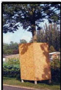
Palissade en bois