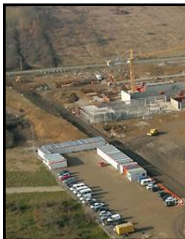
Zone de stationnement des véhicules