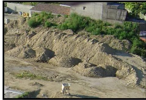
Zone de stockage des terres

De plus : L'entretien des installations de chantier, des accès, des zones de passage, des zones de travail ainsi que des cantonnements est effectué régulièrement. L'encadrement du chantier veille particulièrement au bon état des installations mises à disposition et à la propreté du chantier.