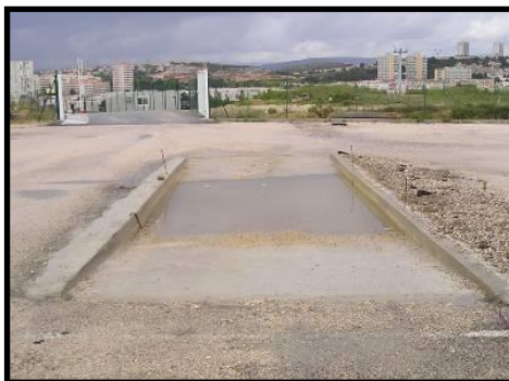
Aire de nettoyage des engins