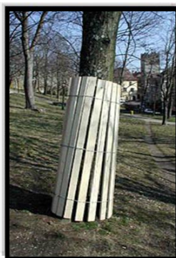
Ceinturage en lattes