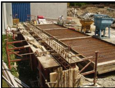
Zone de préfabrication