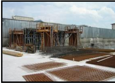
Zone de stockage des aciers et des banches