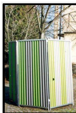
Palissade en acier galvanisé

De plus, les zones sont rapidement replantées.